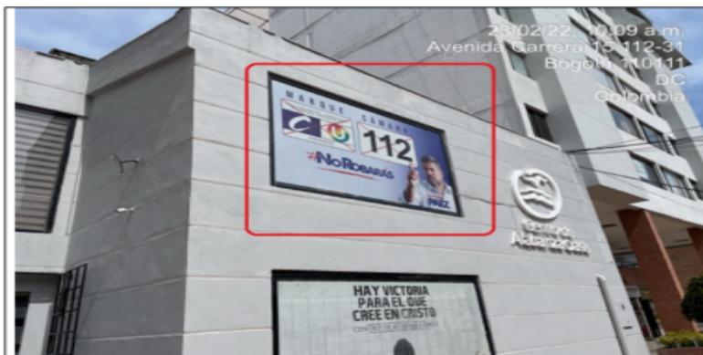
Foto No. 3 En la cual se evidencia un elemento no regulado (microperforado) incorporado en la ventana superior de la edificación, con texto publicitario: "MARQUE CAMARA + LOGO PARTIDO CONSERVADOR Y PARTIDO DE LA U + 112 + #NOROBARÁS + IMAGEN + GUSTAVO PAEZ".